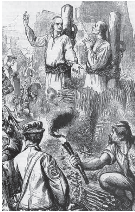
Ридли и Латимър на клада

Хю Латимър също става влиятелен проповедник при управлението на Едуард VI. Той се отличавал