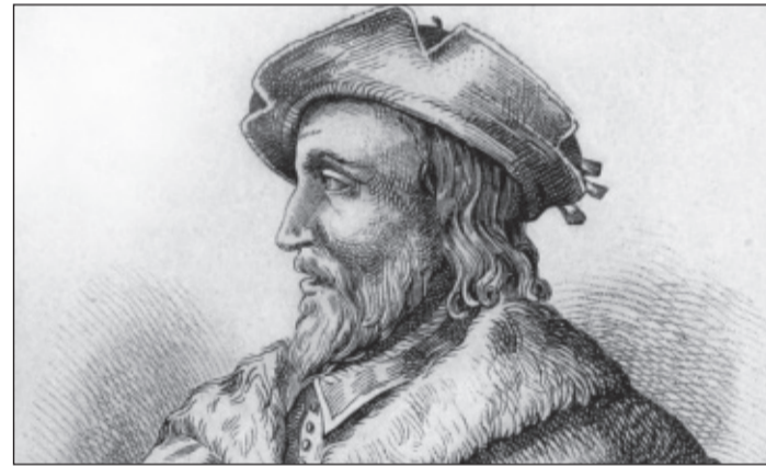
Балтазар Хюбмайер

През 1523 г. го откриваме вече в Цюрих като участник в диспут на страната на Цвингли срещу католиците. Много скоро след това обаче възприема позициите на анабаптизма, които смята за единствено библейски подкрепени.