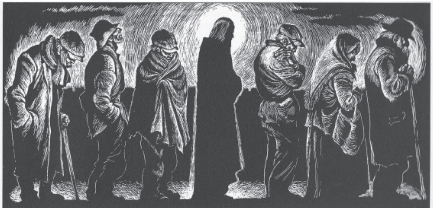
„Христос на опашката за топла супа“ – гравюра на стената на Центъра „Св. Франциск“ в гр. Тампа, щата Флорида, САЩ