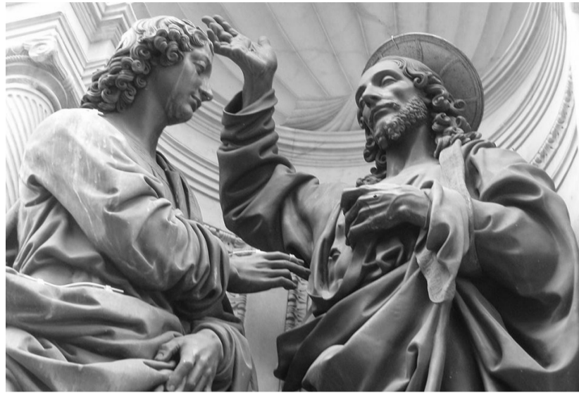
„Христос се явява на ап. Тома“ (фрагмент от скулптурна композиция на Андреа Верокио, XV век)

Има и още нещо, което Исус оценява у Тома. Когато се изправя пред истината, Тома я приема с цялото си сърце и тя става за него дълбоко вътрешно убеждение! Представям си как после той говори пред невярващите: „Братя, и аз не вярвах като вас. Но щом Исус застана пред мен, същият с раните от Кръста, аз капитулирах и възкликнах: Господ мой и Бог мой!“