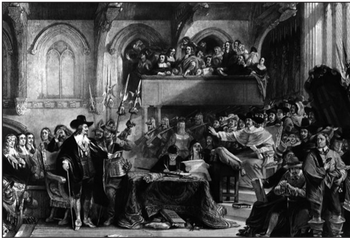
Съдът срещу Чарлз I през 1649 г.

Една от първите цели на Парламента е да привлече на своя страна Шотландия. За съветници в английския парламент са поканени осем представители на шотландската църква. По това време в Шотландия вече е в сила конституция, наречена „Завет“ под библейско влияние. Тя е форма на обществен договор, сключен пред Бога. През 1643 г. в Англия се одобрява подобен конституционен документ, наречен Гържествена лига и Завет .